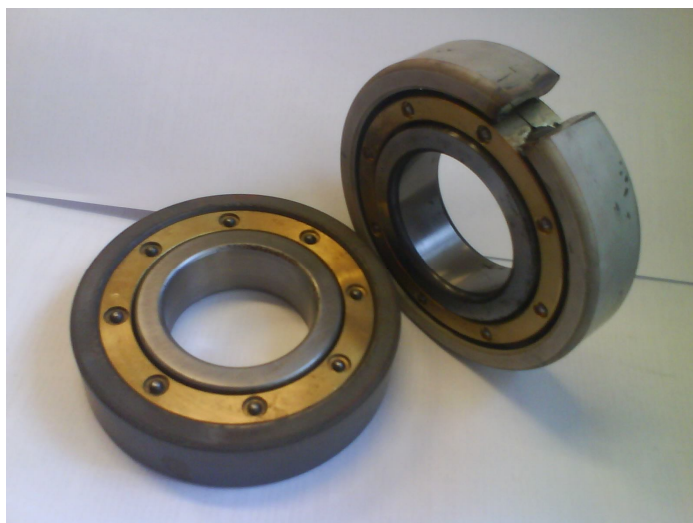
Рис. 2. Подшипники качения с керамическим покрытием, нанесенным на наружное кольцо

В данном случае требуются электроизоляционные керамические покрытия с повышенной адгезионной прочностью, чему соответствуют исследуемые композиции \text{Al}_2\text{O}_3 -7% \text{ZrO}_2 -10% Cu.